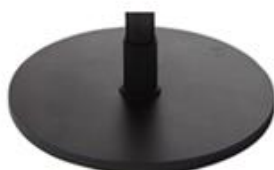
G) SCHIJF ROND ZWART