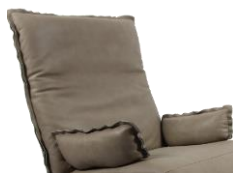
Indi arm L+R