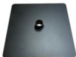
K) SCHIJF VIERKANT ZWART