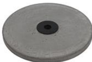
H) BETON ROND