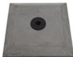
L) BETON VIERKANT