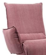
Indi Arm Groot inzittend Rechts