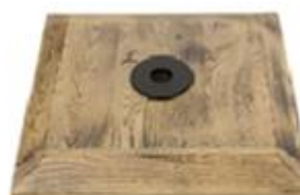
M) VOET HOUT GEBRAND