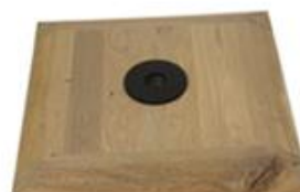
J) VOET HOUT J1) VOET HOUT ZWART