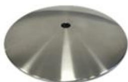
D) PLATVOET D1) PLATVOET ZWART