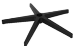
B) 5 TEENS ZWART