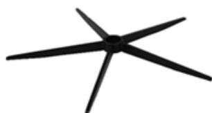
A) STERVOET ZWART