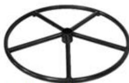
E) STER ROND E1) STER ROND ZWART